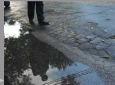
JP Accaccio Fotografo

Calçadas de pedras, asfalto, concreto, Granito, mosaico, jardim, azulejo, Jardim, flores, galhos, matos, Calçadas limpas, Calçadas pintadas, Calçadas rebaixadas, Calçadas, uma zona! Norte a sul, Morar, viver, Ou exibir.