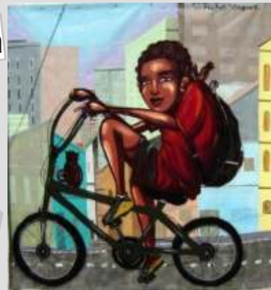
Michel Onger grafiteiro